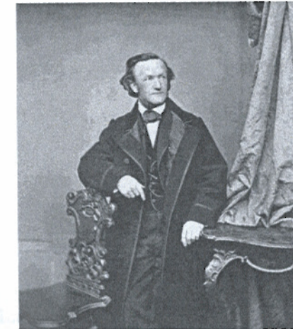
Richard Wagner, um 1860

Giuseppe Verdi ist heute der weltweit am häufigsten gespielte Opernkomponist überhaupt. Richard Wagners Gesamtkunstwerke fordern die Bühnen jedes Mal aufs Neue zu künstlerischen Kraftakten heraus. Wagner, der Weltenentwerfer, der große Egomane, der Antisemit, spaltet seit jeher die Klassikgemeinde. Die einen verachten ihn, von den